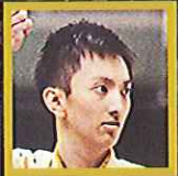
村上 僚 (武術太極拳メダリスト)